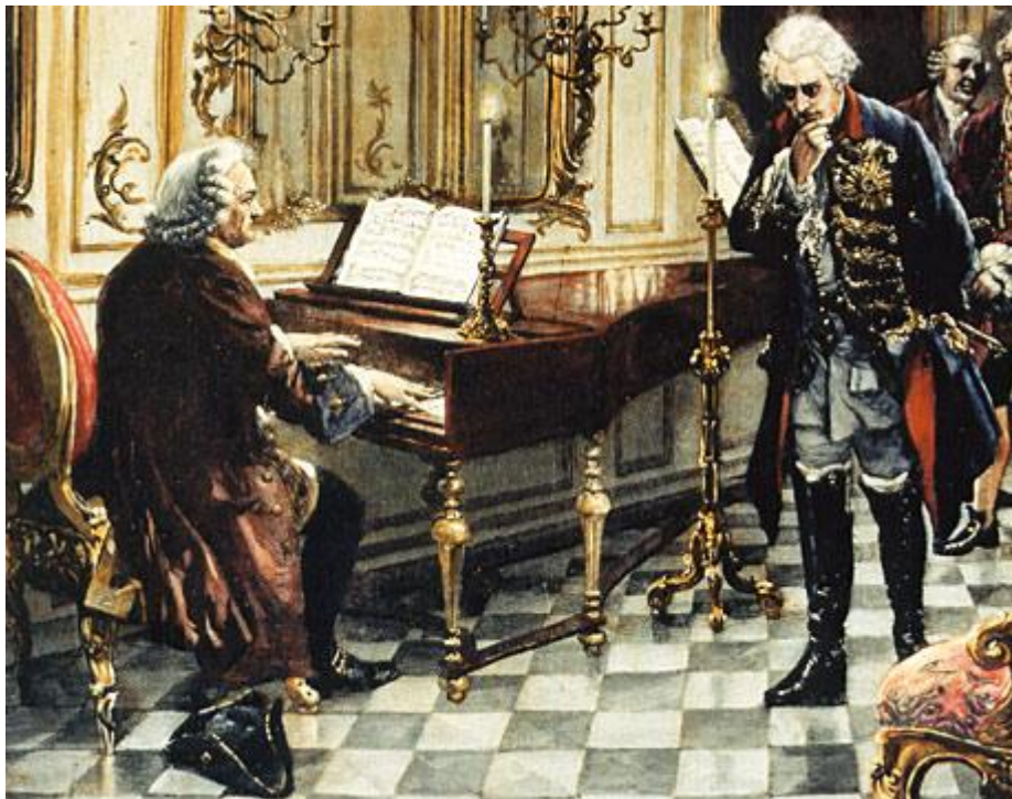
Bach spielt das vom König vorgegebene Thema

Ob der Markgraf auch erfreuten Ohres die ihm gewidmeten sechs „Brandenburgischen Konzerte“ vernahm, ist nicht überliefert. Die erhalten geblichene Originalpartitur enthält keinerlei Hinweis darauf, dass sie damals verwendet worden wäre. Übrigens schloß die Verbindung zwischen Bach und Christian Ludwig ein.