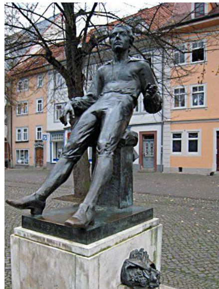
und in jungen Jahren (Denkmal in Arnstadt)

Im März des Jahres 1719 besuchte Bach erstmals die Stadt. Der ehemalige Kapellmeister aus Köthen scheute die Beschwerlichkeiten einer Postkutschenreise nicht, um vom Berliner Hofinstrumentenbauer Mietke ein Cembalo abzuholen. Bach mochte sich sagen, es sei besser, die Qualitätskontrolle am Ort der Produktion vorzunehmen, ehe vielleicht das kostbare Instrument bei Nichtgefallen auf die Retour-Reise müsste. Zum anderen bot sich an, im Berliner Schloss den Markgrafen Christian Ludwig von Brandenburg aufzusuchen, der sich immerhin den Luxus einer eigenen Hofkapelle gestattete, obwohl dieses recht verwegen war; denn der Soldatenkönig liebte Knoten- und Ladestöcke weitaus mehr als Takt-Stöcke. Wer besitzt schon die Stirn, sich der herrschenden Meinung zu widersetzen?