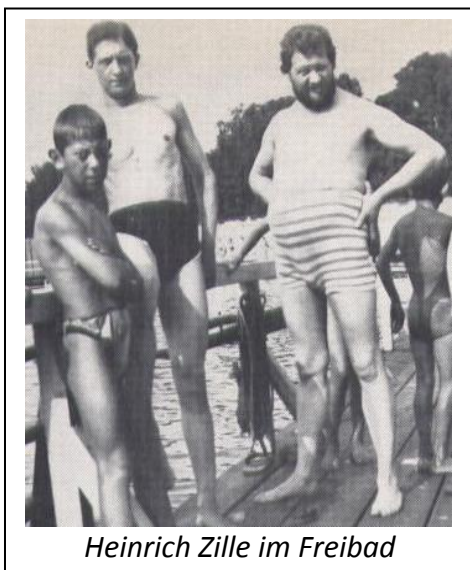
Heinrich Zille im Freibad

23. Mai 1777 (235): Friedrich Wilken wird in Ratzeburg im Herzogtum Lauenburg geboren. Der Historiker und Theologe wurde im Juni 1816 zum Oberbibliothekar der Königlichen Bibliothek in Berlin ernannt.