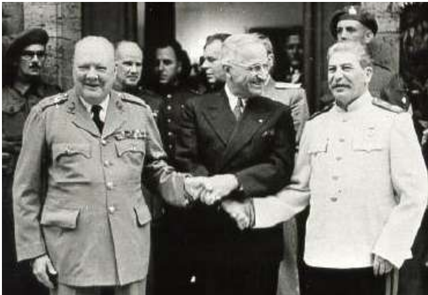
Deutschlands Schicksal lag in ihren Händen: Churchill, (Großbritannien), Truman (USA) und Stalin (UdSSR)

Am 25. Februar sind es 65 Jahre her, dass die neuen Herren Deutschlands, damals verkörpert durch den Alliierten Kontrollrat, Preußen per Dekret auflösten. Über das Kontrollratsgesetz Nr. 46 ist viel und unterschiedlich geurteilt worden, von „überflüssig“ bis „Leichenfledderei“, denn einen selbständigen Staat Preußen gab es 1947 ebenso wenig wie ein souveränes Deutschland. Im Kern war dieses Gesetz auch vorwiegend eine Verwaltungsmaßnahme, der fast alle Bundesländer - alte wie neue - ihre Existenz bzw. ihre heutige Gestalt verdanken: Brandenburg/Berlin und die Provinz-Sachsen, Hannover und Westfalen, das Rheinland und Hessen-Nassau, das Ländchen Hohenzollern sowie Schleswig-Holstein und auch die schlesische Oberlausitz und Vorpommern waren bis dahin preußische Gebietsteile.