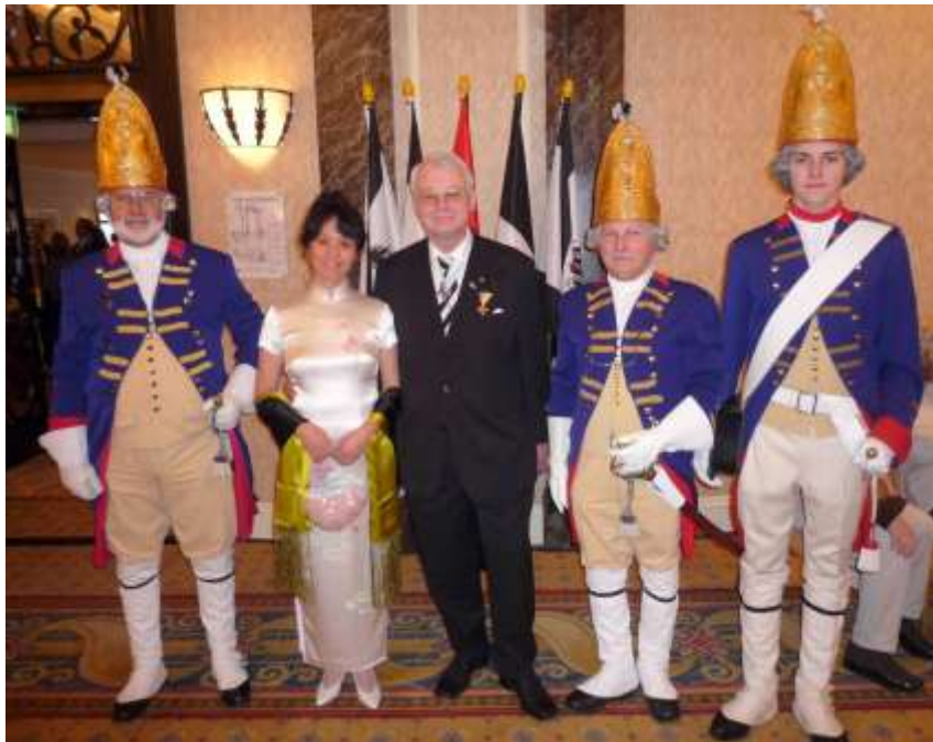
Schwelgen in preußischer und chinesischer Farbenpracht

Der Bund der Steuerzahler, schätzt, dass der doppelte Regierungssitz jährlich 23 Millionen Euro kostet. Folglich nähern sich nach dem so genannten Berlin/Bonn-Gesetz vom 26. April 1994 die vom Steuerzahler zu tragenden Kosten bald der Halb-Milliarden-Grenze. Haben wir's wirklich so dicke?