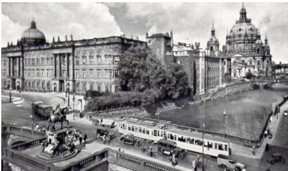
Der Große Kurfürst vor Schloss und Dom

Ein verschämtes Eingeständnis von Schuldgefühl wird an dem wie im neueren Deutschland üblich gewordenen komplizierten und noch dazu teilweise falschen Namen deutlich: Berliner Schloss – Humboldt-Forum. Ein Berliner Schloss hat es nicht gegeben, wohl aber preußisch schlicht das Schloss. Es lag auch nicht in Berlin, sondern in Cölln. Was Rheinländer nicht frühzeitig zum Jubeln bringen sollte, gemeint ist Cölln an der Spree. Die Schwesternstädte vereinigten sich vor 580 Jahren, am 28. Juni 1432. Zuvor hatte seit 1307 eine Union bestanden. Da standen Teile des Hohenzollernschlusses bereits seit langem.