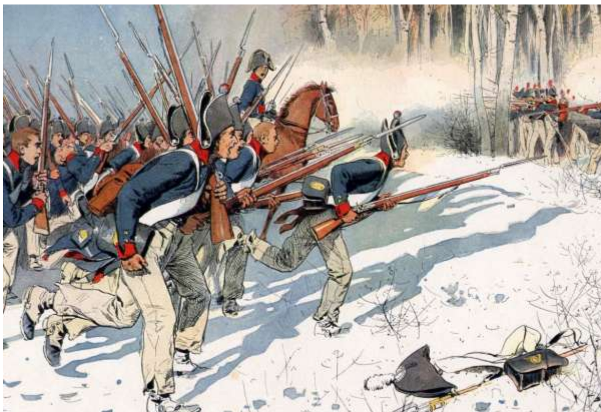
Schlacht bei Preußisch Eylau am 7. und 8. Februar 1807. Szene mit von Scharnhorst befehligten Truppen am Birkenwäldchen bei Kutschitten (heute Snamenskoje)

1. bis 4. Februar 1877: Kulinarisch Großes erlebt die Stadt des Eisbeines und der Bulette mit der ersten Berliner Kochkunstausstellung. Die berühmt-berüchtigte Gartenlaube des Jahrganges 1877 (Nr. 11) schwärmte: „Auf der ersten Kochkunstausstellung, die über alle Erwartung großartig sich gestaltet hat, fiel vor Allem ein mächtiger, wohl fünf Fuß hoher Tafelaufsatz ins Auge, der - aus Krebsen bestand. Es waren ihrer dreihundert; keiner von ihnen maß in seiner ganzen Länge unter zwölf Zoll. An einem Drahtgestelle kunstvoll befestigt, bildeten sie in ihrer Gesamtheit die Form einer schöngeschweiften Vase, und zartblättrige Petersilienbüschel wechselten malerisch mit den roten, derben Gesellen ab, deren mächtige breite Scheeren, wie zum Gruße des Beschauers, nach vorn herüber hingen.“