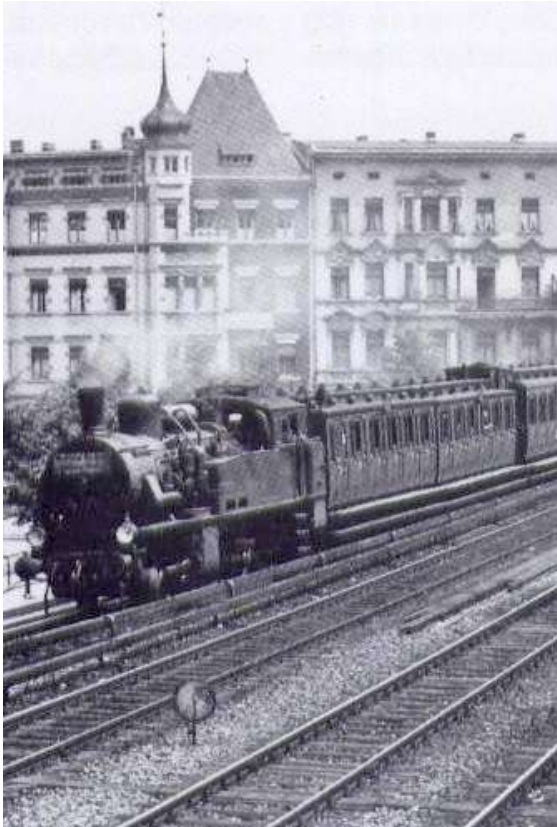
Die Stadtbahn unter Dampf hatte hölzerne Abteilwagen

7. Februar 1882: Die erste Berliner Stadtbahn verkehrt unter Dampf zwischen Charlottenburg-Schlesischer Bahnhof (heute: Ostbahnhof). Am Tag zuvor hatte Kaiser Wilhelm I. die Strecke befahren.