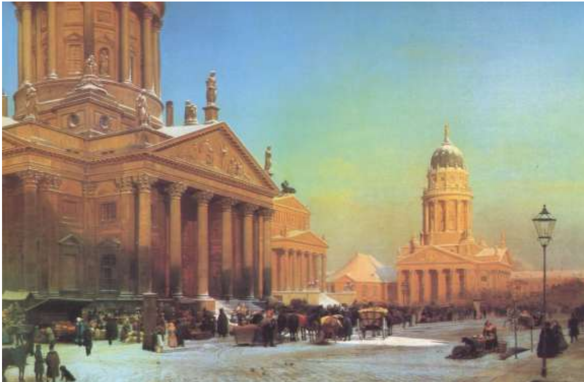
Der Gendarmenmarkt im Winter – Eduard Gaertners schönes Ölgemälde von 1857. An diesem Platz hat die Preußische Gesellschaft ihr Stammquartier

Ein Wort zum Gendarmenmarkt. Ich betrachte es als eine glückliche Fügung, dass die Preußische Gesellschaft seit 15 Jahren an diesem zutiefst preußischen Platz residiert, der von Friedrich dem Großen einen weltstädtischen Schliff erhielt und der in aller Welt Freude und Bewunderung auslöst. Enger lässt sich unsere Verbindung zu ihm und den Preußen sicher nicht dokumentieren – es sei denn, wir bekämen ein Domizil im schlossähnlichen Humboldt-Forum.