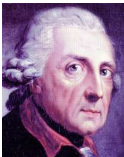
Preußens großer König

„Wir können in Deutschland stolz darauf sein, dass es trotz aller medienunterstützter Negativhaltung zu unserem Volk und Staat Vereinigungen wie die Preußische Gesellschaft gibt, die eine klare Richtung hat und aus einer überzeugenden Werthaltung heraus die großartigen Leistungen, um die Preußen und Deutschland beneidet worden sind, auch in Zukunft bewahren will. Ganze besonders danke ich dem Präsidenten! Ich wünsche Ihnen viel Kraft für die Zukunft und Gottes Segen.“